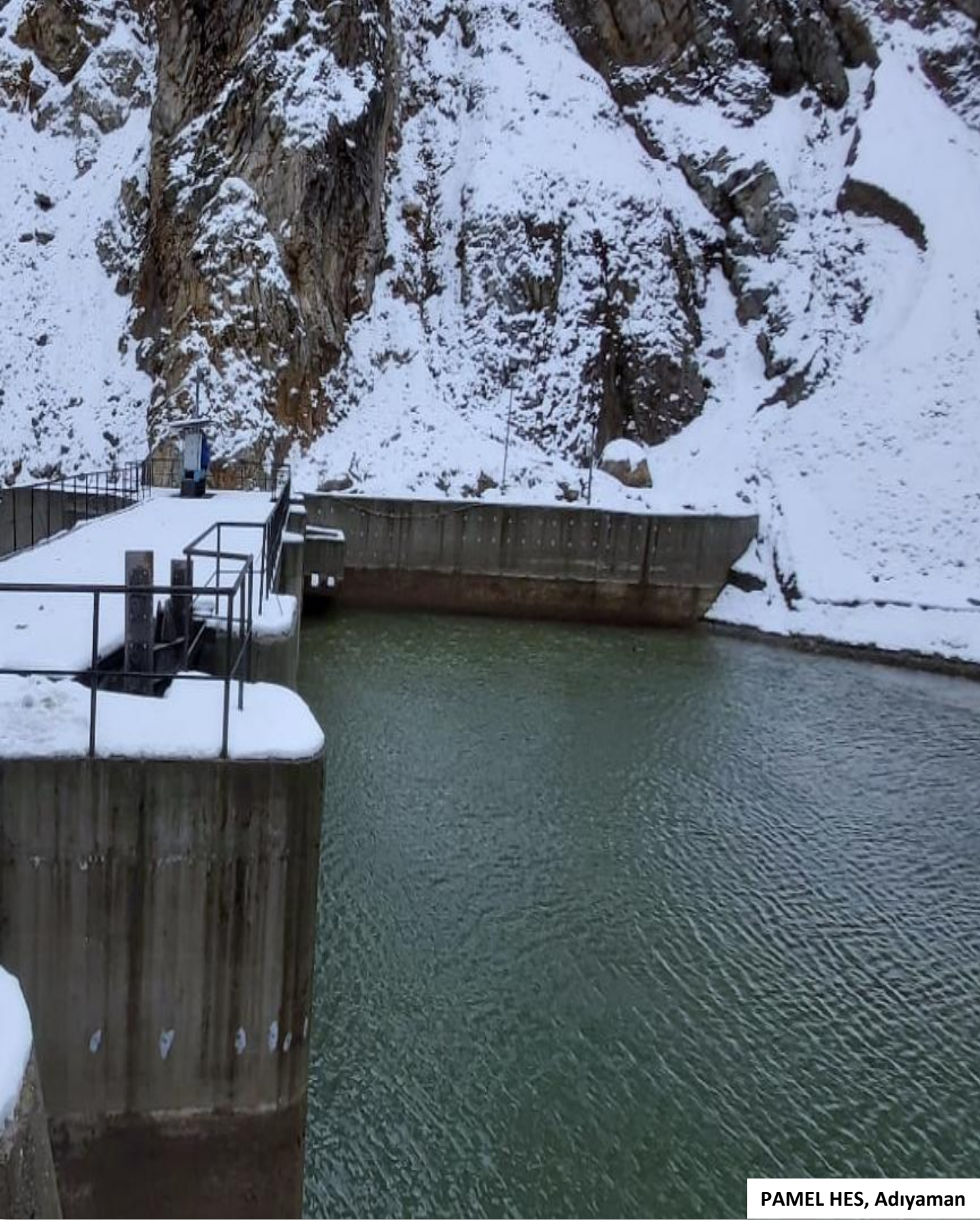
PAMEL HES, Adiyaman