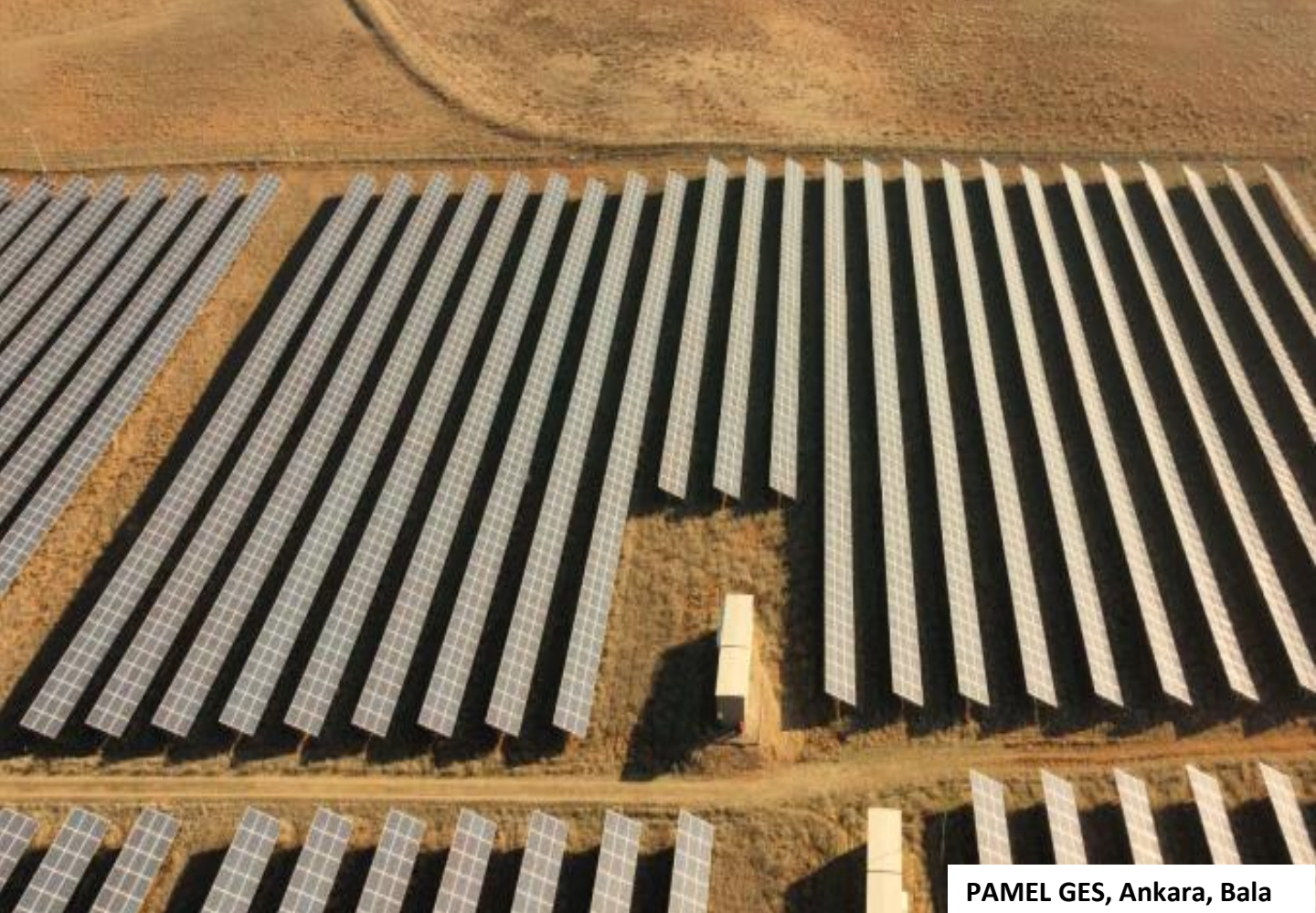
PAMEL GES, Ankara, Bala