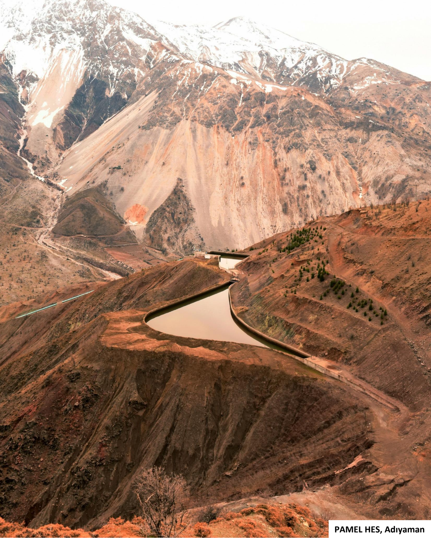
PAMEL HES, Adiyaman